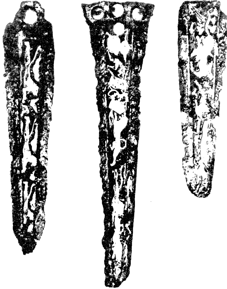
شكل ٤ - خنجر من البرنز طعمت أنصالحا بمناظر تمثل حياة الصيد البطولية ، وهي من الذهب والفضة . مجموعة المقابر الأولى .